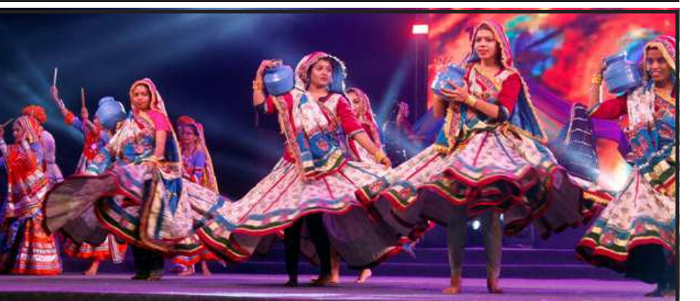
નવરાત્રિ ઉત્સવની પરંપરાગતરીતે શરૂઆત થઇ હતી. જુએમડીસી ગ્રાઉન્ડ ખાતે ગરબાની ધૂમ ખેલા મળી હતી.

જિલ્લાના ગામોમાં એકતા રથ જીવન કવન અને યોગદાન વિષયક નિબંધ સ્પર્ધા, પ્રશ્નોત્તરી સ્પર્ધા, ચર્ચા સ્પર્ધાઓ યોજાશે તેમજ વિશેષ રથ સાથે રાષ્ટ્રીય એકતા અંતર્ગત વિડીયો પણ પ્રદર્શિત કરાશે. ગામોમાં રાત્રી દરમિયાન કૃષિ વિષયક માહિતી, ખેડૂત સભા પણ યોજાશે.