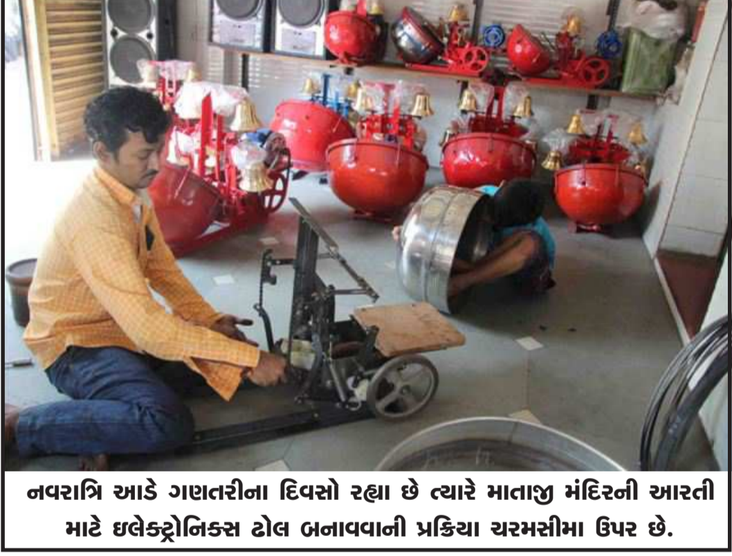
નવરાત્રિ આડે ગણતરીના દિવસો રહ્યા છે ત્યારે માતાજી મંદિરની આરતી માટે ઇલેક્ટ્રોનિક્સ ટોલ ઊનાવવાની પ્રક્રિયા ચરમસીમા ઉપર છે.

આપણે એક તપસ્વી ગુમાવી દીધા છે : રૂપાણીની પ્રતિક્રિયા (સંપૂર્ણ સમાચાર સેવા) અમદાવાદ, તા.૭ સૌરાષ્ટ્રના સૌથી મોટી વયના સંત અને સંત શિરોમણી, કાંતિકારી વિચારક, મહંત, કન્યા કેળવણી અને ધર્મની સાથે સમાજ સેવાના ઉદ્ધારક એવા જૂનાગઢ જિલ્લાના મહંત શ્રી ગોપાલાનંદ બાપુ તાજેતરમાં બ્રહ્મલીન થતાં, મુખ્યમંત્રી વિજય રૂપાણીએ આજે બિલખા સ્થિત તેમના આશ્રમમાં શ્રી ગોપાલાનંદ બાપુને ભાવાંજલિ આપી હતી. તેમને શ્રદ્ધાંસુમન અર્પણ કરતા મુખ્યમંત્રીએ શ્રદ્ધાંજલિ સભામાં જણાવ્યું હતું કે, આપણે એક કાંતિકારી અને તપસ્વી સંત ગુમાવ્યા છે. બ્રહ્મલીન સંત શ્રી ગોપાલાનંદ બાપુએ આખી જિંદગી માનવ સેવા એ જ પ્રભુ સેવાનો જીવન મંત્ર અપનાવી સેવાની ધૂણી ધખાવી હતી મુખ્યમંત્રીએ સમગ્ર ગુજરાતની જનતા વતી શ્રી ગોપાલાનંદ બાપુને શ્રદ્ધાંજલિ આપી કહ્યું કે, તપસ્વી સંતનું જીવન આપણા સૌના માટે પથદર્શક છે. મુખ્યમંત્રીએ વધુમાં કહ્યું કે, ગિરનાર વિસ્તારમાં વિકાસના કાર્યો હોય કે સમાજ-કલ્યાણ, લોકકલ્યાણની વાત હોય ગોપાલાનંદ બાપુએ તેમના વિચાર મુકીને આપણને સૌને પ્રેરિત કર્યા છે. ધર્મની રક્ષા, માનવતાના મૂલ્યો, શિક્ષણ અને ધર્મનીતિનું માર્ગદર્શન આપણને તેમની પાસેથી મળ્યું છે તેમ પણ કહ્યું હતું. શિવરાત્રીના દિવસોમાં તેમના આશીર્વાદ લેવાનો અવસર પ્રાપ્ત થયો હતો. તે અંગે ધન્યતા અનુભવી મુખ્યમંત્રીએ કહ્યું કે, ગુજરાત તેમના આશીર્વાદથી આગળ વધતું રહેશે. બિલખા સ્થિત શ્રદ્ધાંજલી સભામાં મહંતશ્રી મુક્તાનંદ બાપુ, સતાધારના લઘુમહંત શ્રી વિજય બાપુ, પરબના કરસનદાસ બાપુ, કનકેશ્વરીદેવી, શ્રી શેરનાથ બાપુ, શ્રી રામકૃષ્ણનંદ, પાળિયાદના નિર્મળા બા, ચલેયાધામના રામરૂપદાસજી, શીતલદાસ બાપુ, બિલખા, ચાપરાડા અને જૂનાગઢના વિવિધ આશ્રમના સંતો-મહંતો, અગ્રણીઓ, ભાવિકો મોટી