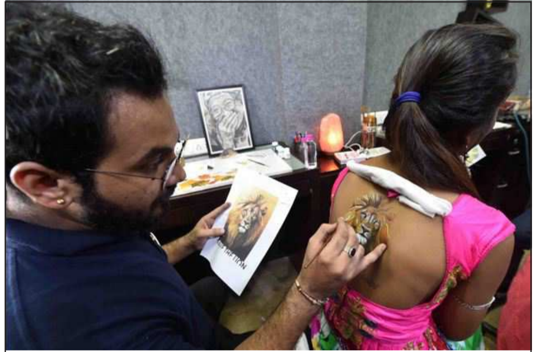
દર વર્ષની જેમ જ આ વર્ષે પણ નવરાત્રિમાં ટેટૂનો કેન્ડ્ર યુવતીઓમાં વિશેષ જોવા મળી રહ્યો

(સંપૂર્ણ સમાચાર સેવા) દહેરાદૂન, તા. ૭ દહેરાદૂનમાં ઈન્વેસ્ટર્સ સમિટમાં પહોંચેલા વડાપ્રધાન નરેન્દ્ર મોદીએ વિવિધ મુદ્દા ઉપર વાત કરી હતી. પોતાના સંબોધનમાં મોદીએ કહ્યું હતું કે, આજે ઉત્તરાખંડમાં તમામ ઔદ્યોગિક સમુહના લોકો એકત્રિત થઈ રહ્યા છે. દેશ પરિવર્તનના એક મોટા તબક્કામાંથી પસાર થઈ રહ્યું છે. દેશમાં પરિવર્તનને લઈને અભૂતપૂર્વ શક્યતા રહેલી છે. આવનાર સમયમાં અનેક મોટા કામો થવા જઈ રહ્યા છે. દુનિયાની તમામ મોટી સંસ્થાઓ માની રહી છે કે, ભવિષ્યમાં ૮૦ કરોડ યુવાઓ ધરાવનાર ભારત દુનિયાની પ્રગતિ માટે એક ગ્રોથ એન્જિન તરીકે સાબિત થશે. નવા ભારતના વિકાસમાં ઉત્તરાખંડની પણ મોટી ભૂમિકા છે. આજનું ઉત્તરાખંડ યુવા અને ઉર્જાથી ભરેલું છે. અહીં વિકાસની વ્યાપક તકો રહેલી છે. ૧૩ નવા પ્રવાસ સ્થળોના વિકાસની પહેલ કરવામાં આવી ચુકી છે. દેશમાં એવિએશન સેક્ટરના વિકાસ માટે આશરે ૧૦૦ નવા એરપોર્ટ અને હેલિપેડ બનાવવાની દિશામાં કામ કરવામાં આવી રહ્યું છે. ઈન્વેસ્ટર્સ સમિટ બે દિવસ સુધી